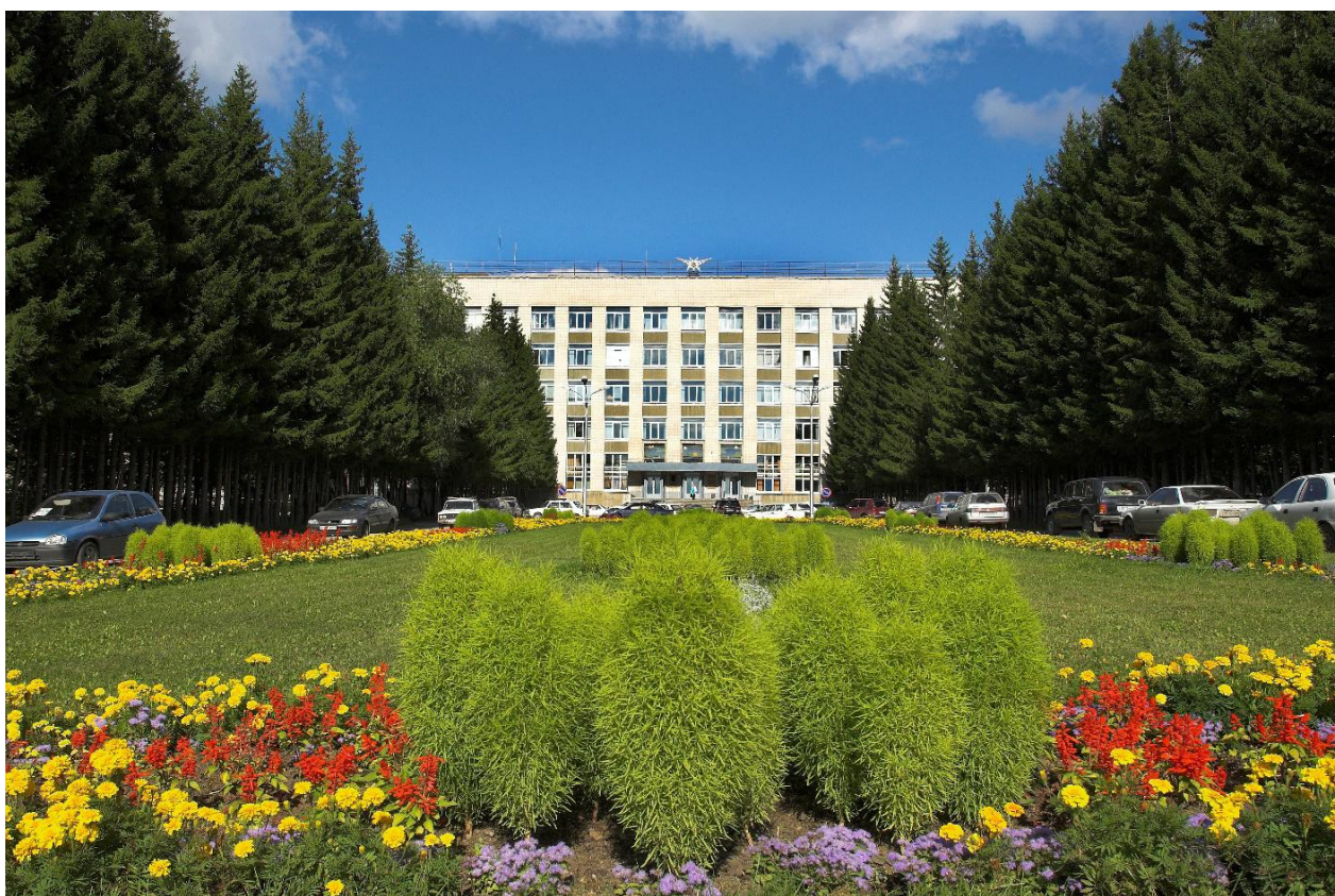
Рис. 6. Институт ядерной физики им. Г. И. Будкера Сибирского отделения РАН