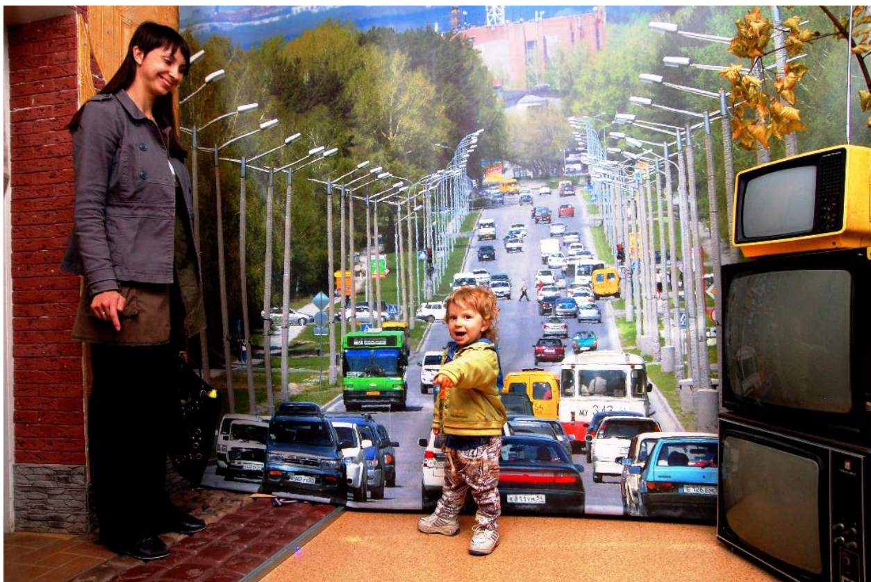
Рис. 3. В Музее науки и техники Сибирского отделения РАН