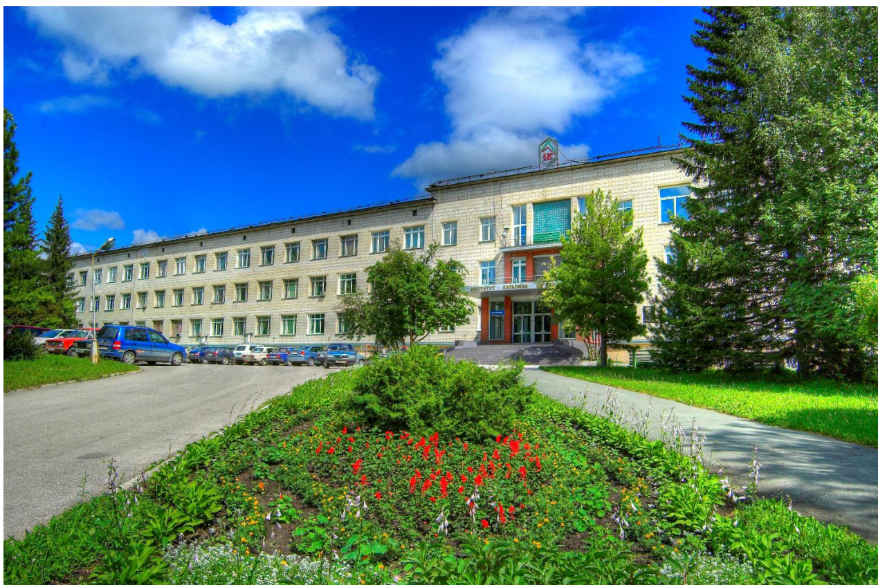
Рис. 8. Институт катализа им. Г.К. Борескова Сибирского отделения РАН