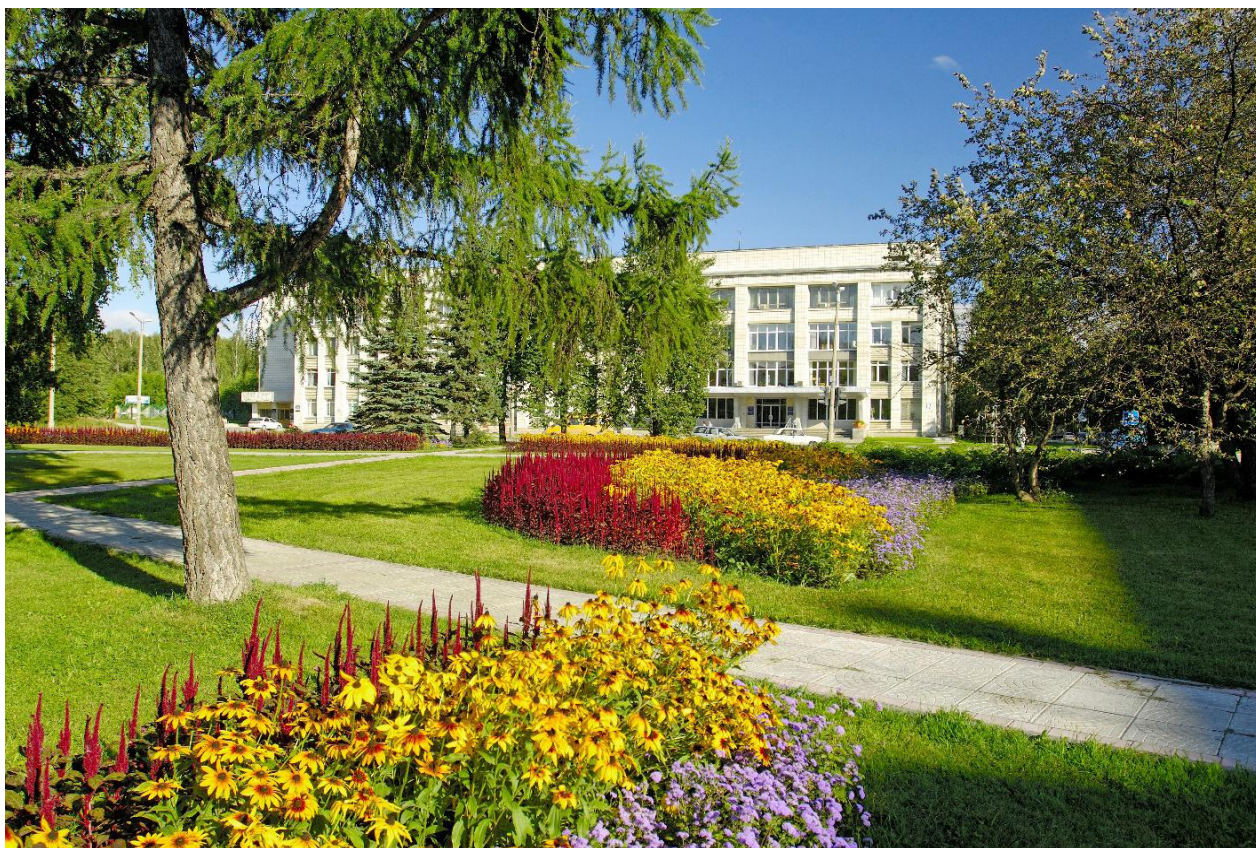
Рис. 5. Институт экономики и организации промышленного производства Сибирского отделения РАН