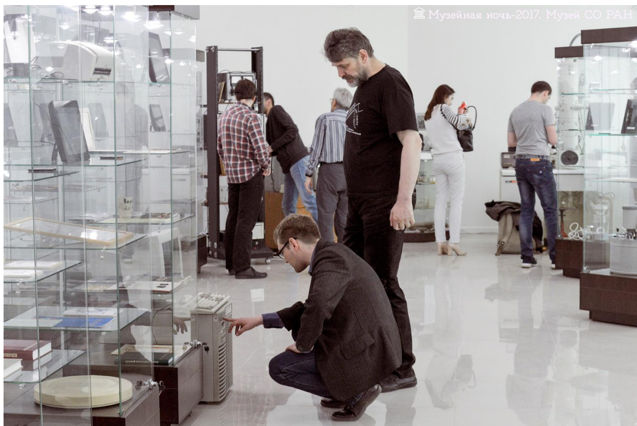
Рис. 4. В Музее СО РАН