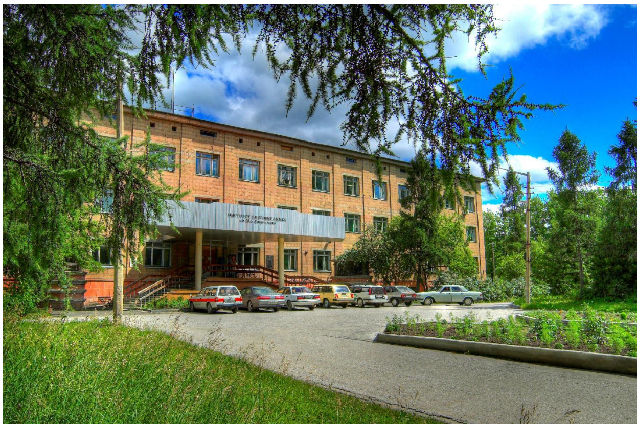
Рис. 1. Институт гидродинамики им. М. А. Лаврентьева Сибирского отделения РАН

Совершим экскурс в историю: первое название этой, ставшей знаменитой, улицы – проспект Науки. Переименован он был после смерти основателя Академгородка академика М. А. Лаврентьева (1900–1980).