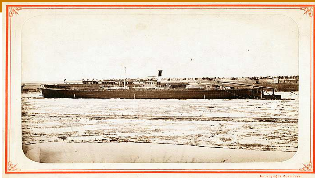
Часть Обь-Енисейского водного пути. Отъ р. Кети до р. Енисея.