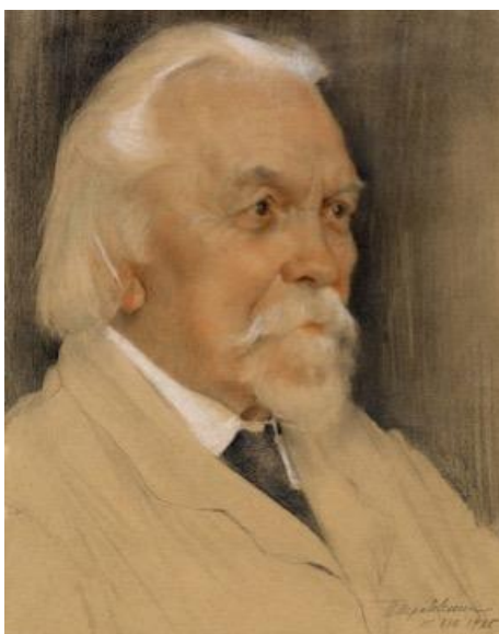
Рис. 1. Академик А.П. Карпинский. 1925 г.