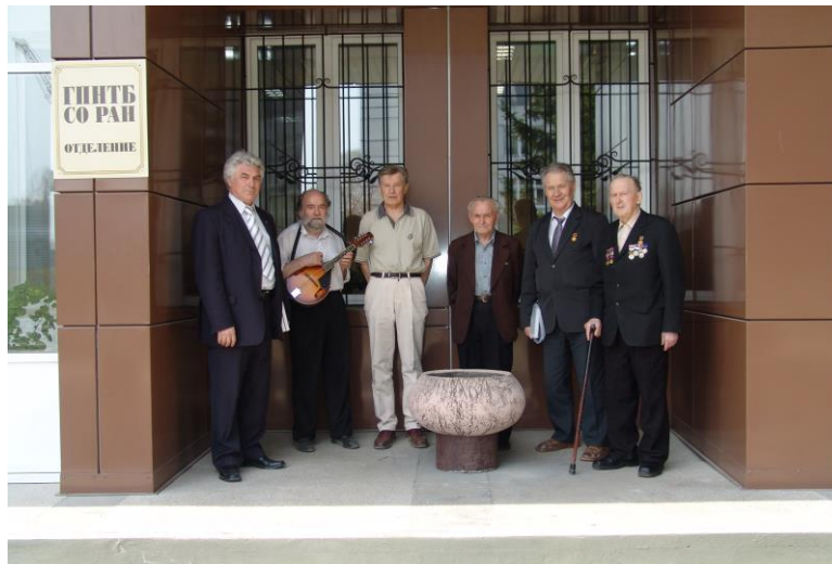
2007 год. Заслуженные изобретатели на встрече, посвященной 50-летию СО РАН.

Л. А. Дмитриева, научный сотрудник, зав. сектором патентной документации Отделения ГПНТБ СО РАН