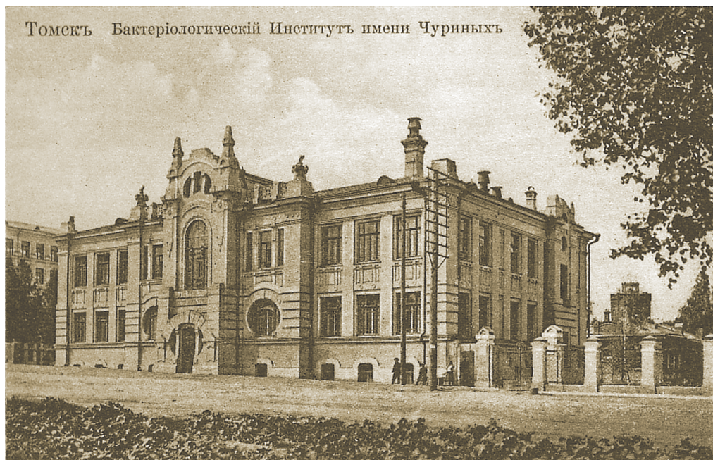
Бактериологический институт им. Чуриных в Томске