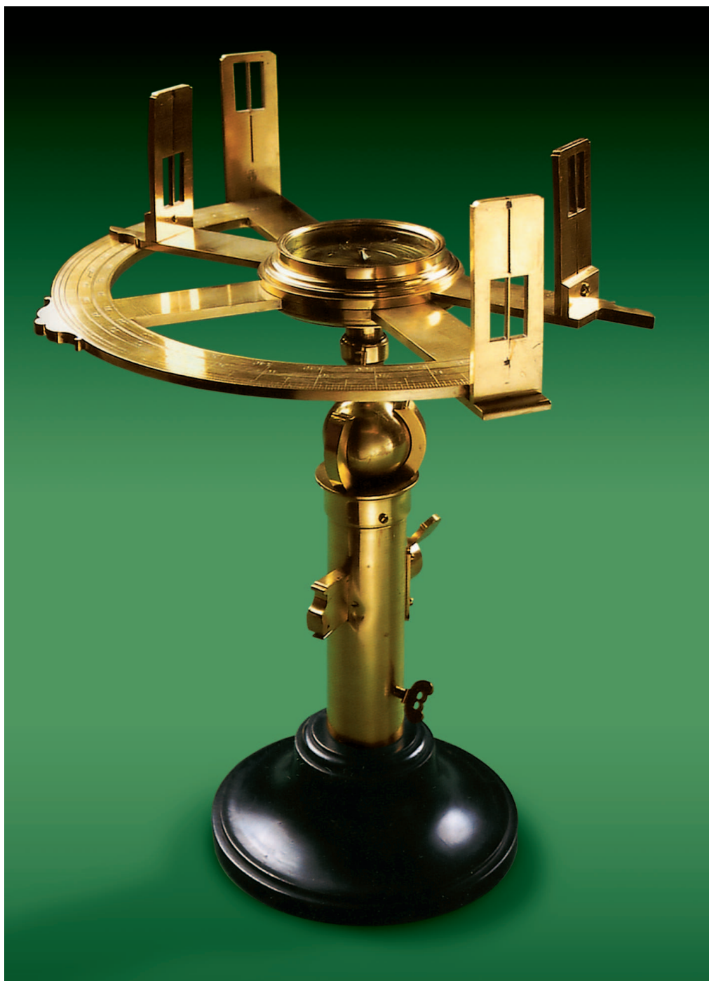
Астролябия. XVIII век