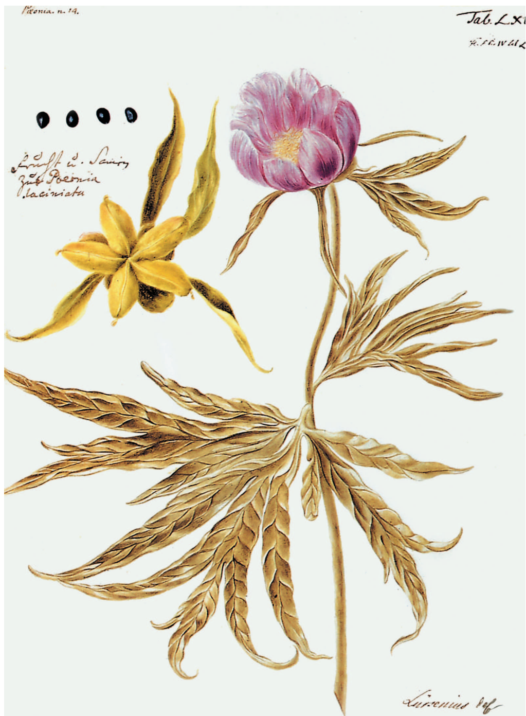
Из коллекции И.В. Люрсениуса, участника Второй Камчатской экспедиции (Санкт-Петербургский филиал Архива РАН)