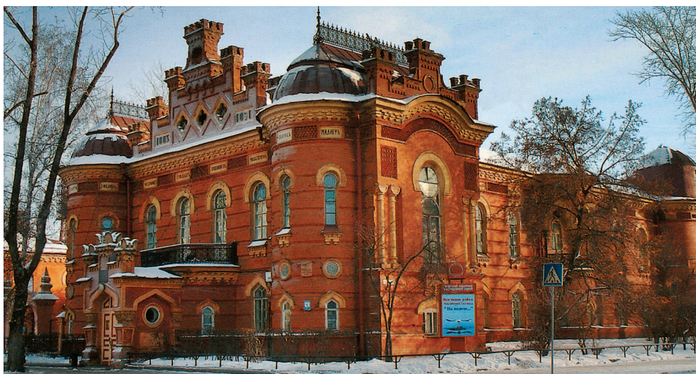
Здание ВСОИРГО в Иркутске