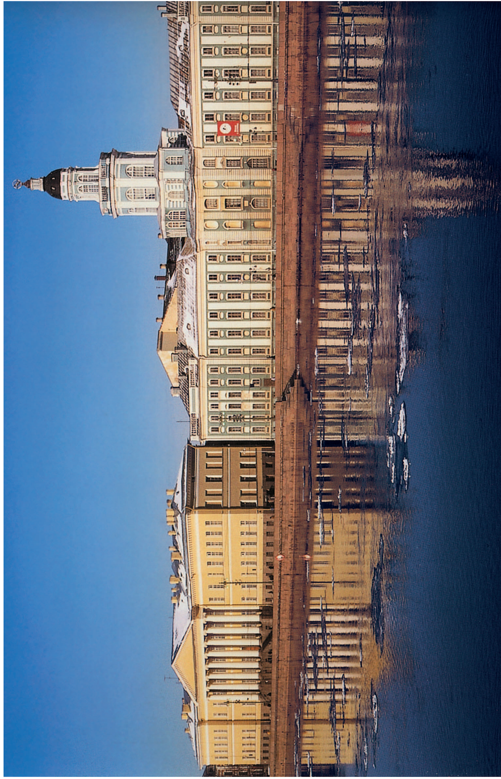
Здание Академии наук в Санкт-Петербурге