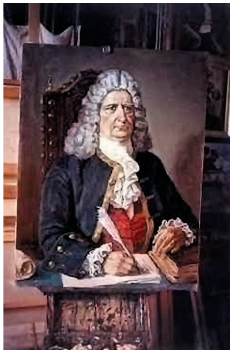
Г.Ф. Миллер (художник Э. Козлов)