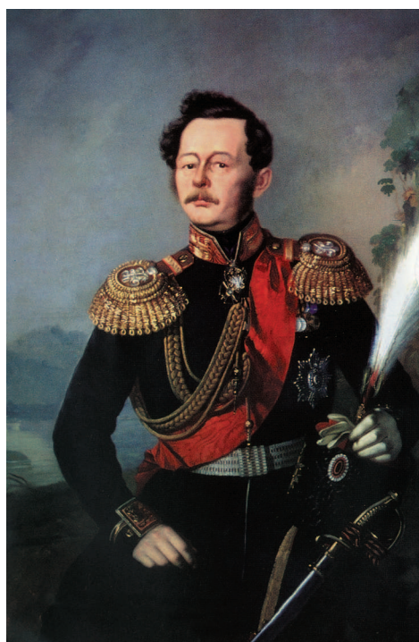
Н.Н. Муравьев-Амурский — инициатор открытия СОИРГО