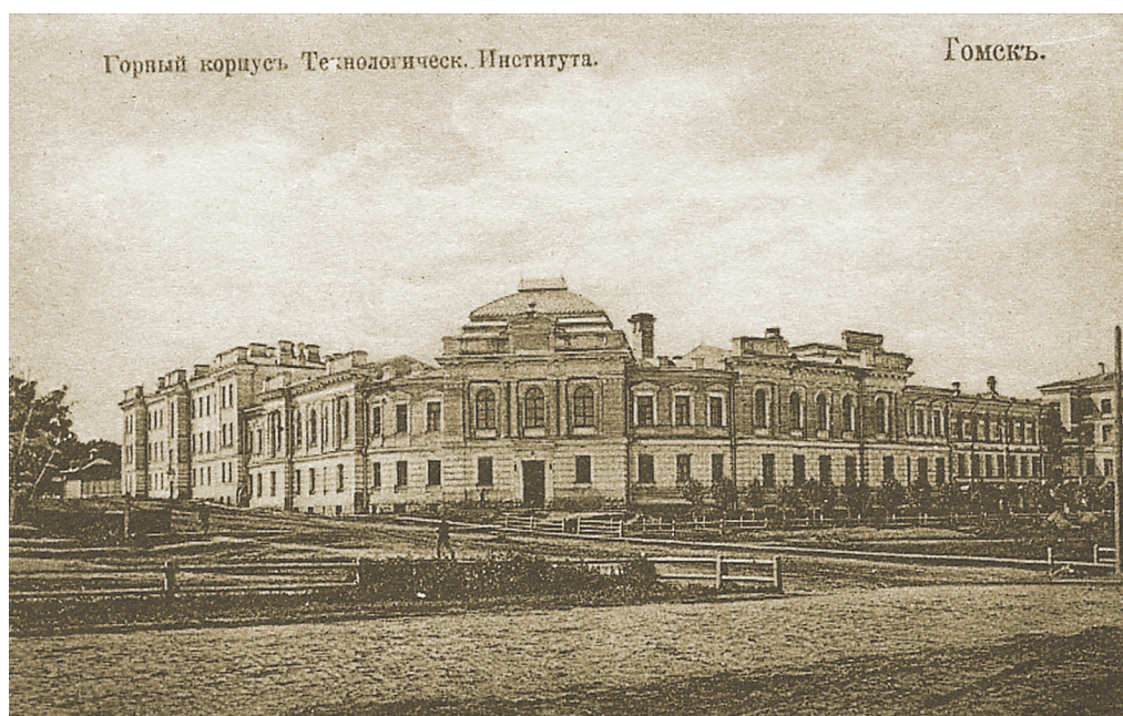
Горный корпус Томского технологического института. Начало XX века