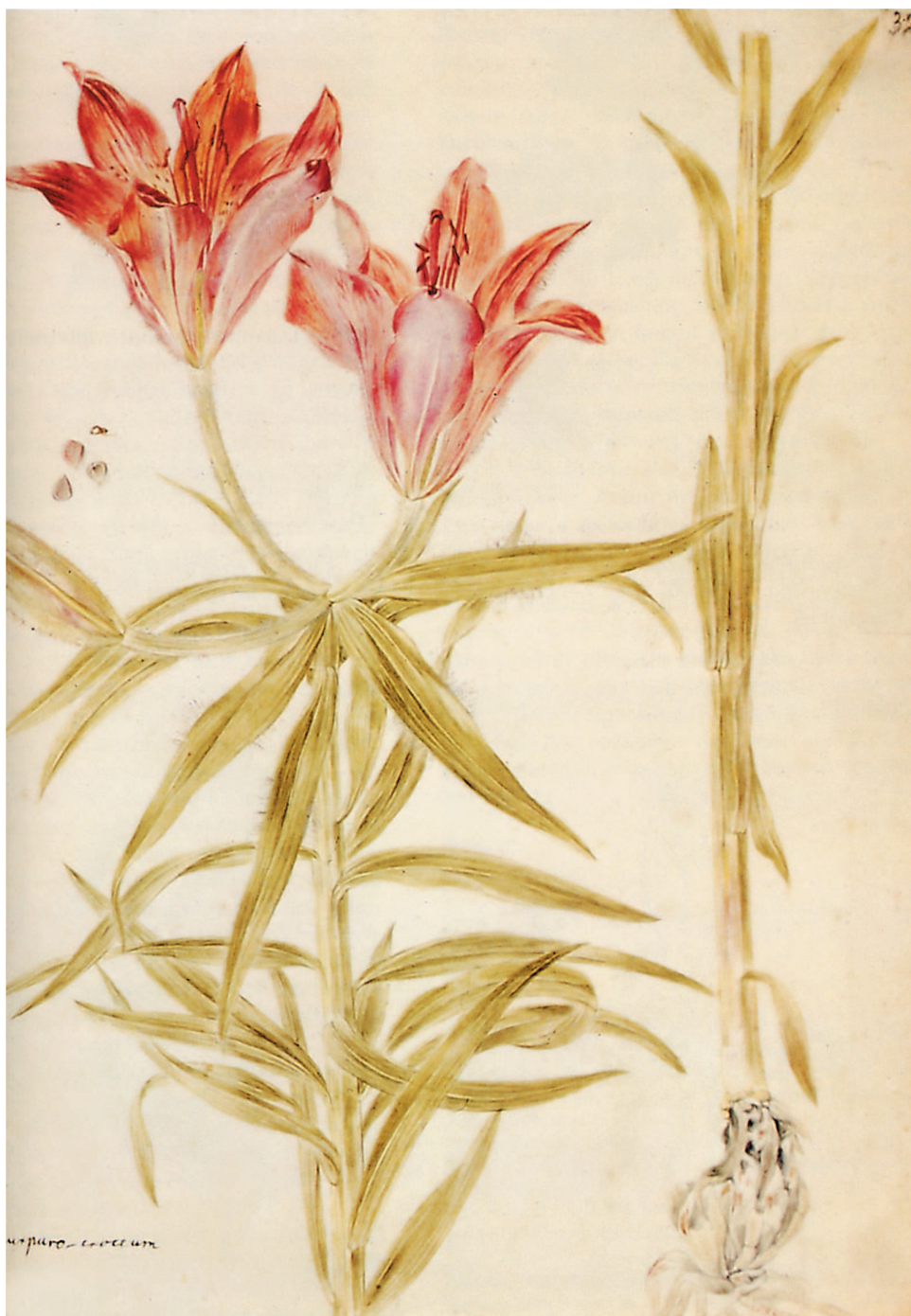
Из Сибирской коллекции И.Х. Бергмана, участника Второй Камчатской экспедиции (Санкт-Петербургский филиал Архива РАН)