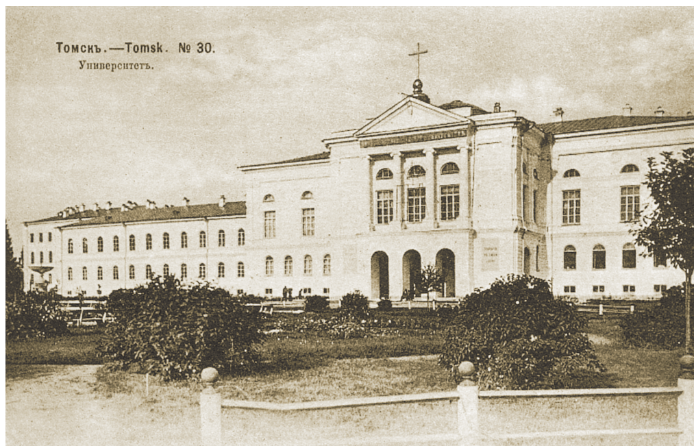
Томский университет. 1903 год