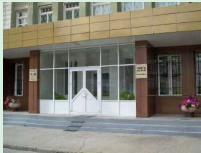
Отделение ГПНПБ СО РАН, 2012