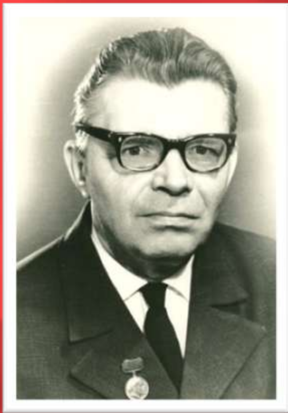
Семёнов Леонид Иванович (1915–1986)