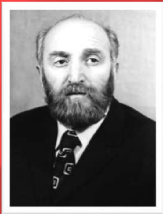
Будкер Герш Ицкович (1918-1977)

1941 -1945 гг. - гвардии лейтенант, инспектор дивизии по приборам, воевал на Дальневосточном фронте в войсках Противовоздушной обороны. Награжден медалью «За победу над Японией».