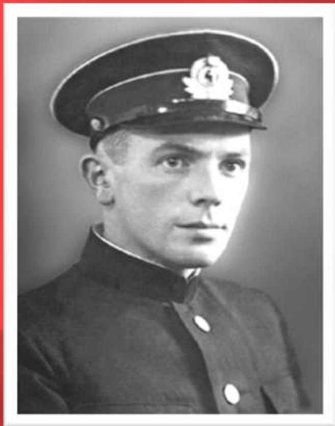
Канторович Леонид Витальевич (1912-1986)